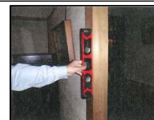
水平器による柱の傾きの計測