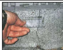
基礎のひび割れ幅の計測